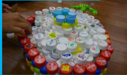
新しい花になった