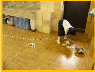
ゆかの上にならべよう。