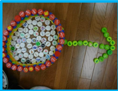
大きな花がさいた