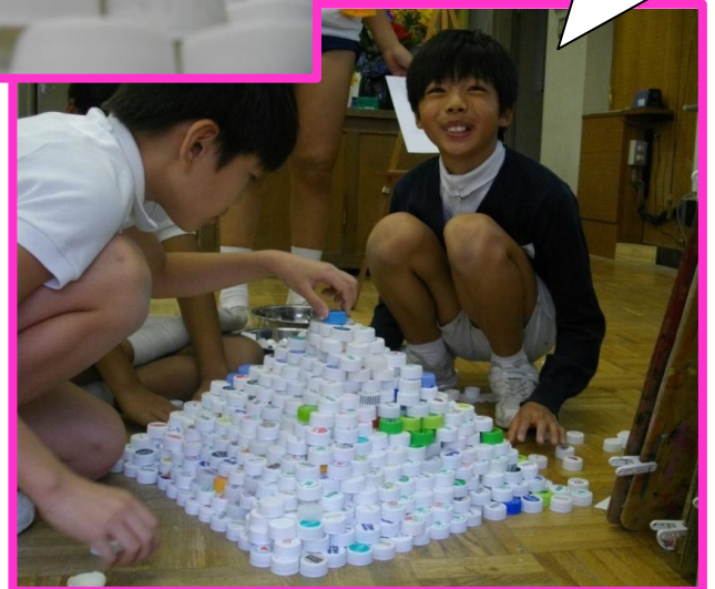
一人でやっていたんだけど、なかまが増えたんだ！