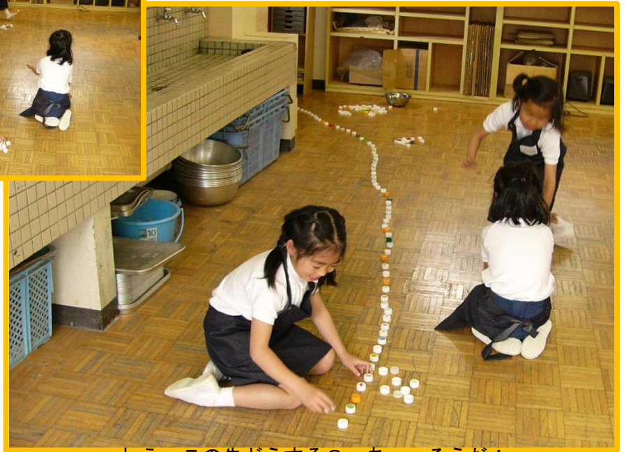
ねえ、この先どうする？ あっ、そうだ！